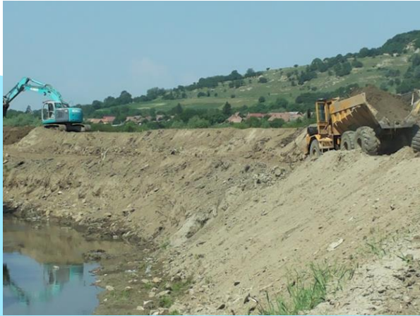
A Nyárád folyó a szabályozás közben